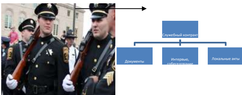
Рисунок 1 - Процесс заключения служебного контракта [8, с. 46]

Если рисунок взят из первичного источника без авторской переработки, следует сделать ссылку, например: