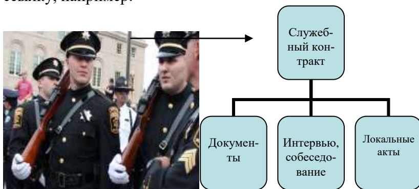
Рисунок 1 - Процесс заключения служебного контракта [8, с. 46]

Если рисунок взят из первичного источника без авторской переработки, следует сделать ссылку, например: