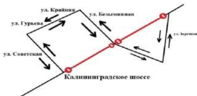
Рисунок 2 – Схема объезда 1

Если рисунок является авторской разработкой, необходимо после заголовка рисунка поставить знак сноски и указать в форме подстрочной сноски внизу страницы, на основании каких источников он составлен, например: