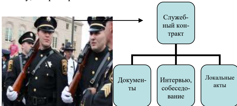
Рисунок 1 - Процесс заключения служебного контракта [8, с. 46]

Если рисунок взят из первичного источника без авторской переработки, следует сделать ссылку, например: