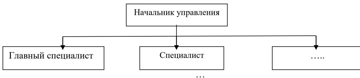
Рисунок 1 – Структура управления

заголовок и подписываться следующим образом – посередине строки без абзацного отступа, например: