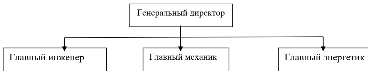
Рисунок 1 – Структура администрации организации

Рисунки, за исключением рисунков в приложениях, следует нумеровать арабскими цифрами сквозной нумерацией по всей работе. Каждый рисунок (схема, график, диаграмма) обозначается словом «Рисунок», должен иметь заголовок и подписываться следующим образом – посередине строки без абзачного отступа, например: