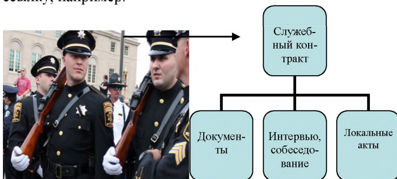
Рисунок 1 - Процесс заключения служебного контракта [8, с. 46]

Если рисунок взят из первичного источника без авторской переработки, следует сделать ссылку, например: