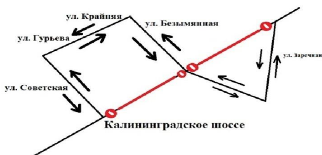
Рисунок 2 – Схема объезда 5

Если рисунок является авторской разработкой, необходимо после заголовка рисунка поставить знак сноски и указать в форме подстрочной сноски внизу страницы, на основании каких источников он составлен, например: