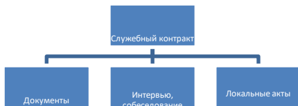
Рисунок 1 - Процесс заключения служебного контракта [8, с. 46]

Если рисунок является авторской разработкой, необходимо после заголовка рисунка поставить знак сноски и указать в форме подстрочной сноски внизу страницы, на основании каких источников он составлен, например: