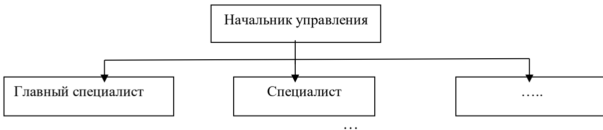
Рисунок 1 – Структура управления

Рисунки следует нумеровать арабскими цифрами сквозной нумерацией по всей работе. Каждый рисунок (схема, график, диаграмма) обозначается словом «Рисунок», должен иметь заголовок и подписываться следующим образом – посередине строки без абзацного отступа, например: