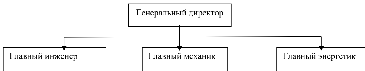
Рисунок 1 – Структура администрации организации

Рисунки, за исключением рисунков в приложениях, следует нумеровать арабскими цифрами сквозной нумерацией по всей работе. Каждый рисунок (схема, график, диаграмма) обозначается словом «Рисунок», должен иметь заголовок и подписываться следующим образом – посередине строки без абзацного отступа, например: