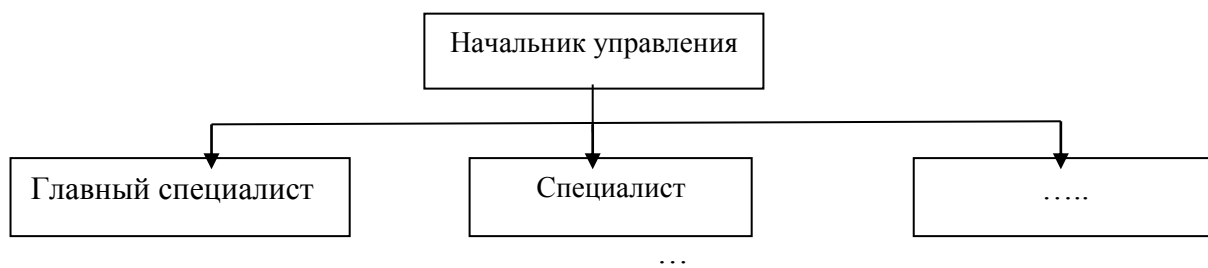
Рисунок 1 – Структура управления

Рисунки следует нумеровать арабскими цифрами сквозной нумерацией по всей работе. Каждый рисунок (схема, график, диаграмма) обозначается словом «Рисунок», должен иметь заголовок и подписываться следующим образом – посередине строки без абзацного отступа, например: