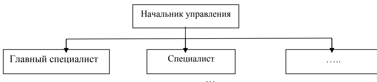
Рисунок 1 – Структура управления

Рисунки следует нумеровать арабскими цифрами сквозной нумерацией по всей работе. Каждый рисунок (схема, график, диаграмма) обозначается словом «Рисунок», должен иметь заголовок и подписываться следующим образом – посередине строки без абзацного отступа, например: