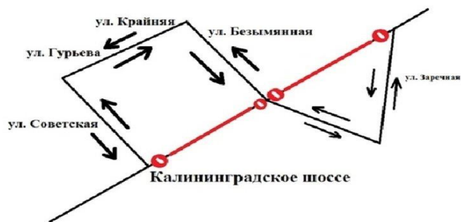
Рисунок 2 – Схема объезда 3